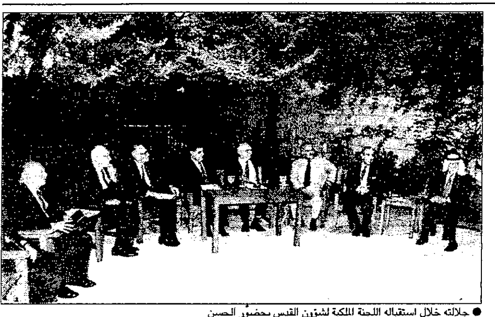
جلالته خلال استقباله اللجنة الملكية لشؤون القدس بحضور الحسن

صيغة اردنية لمعالجة وضع القدس والدعوة لتنسيق اردني فلسطيني مكثف وعاجل مشروع قمة خماسية في واشنطن وخطة على المسار الفلسطيني لتنشيط المفاوضات